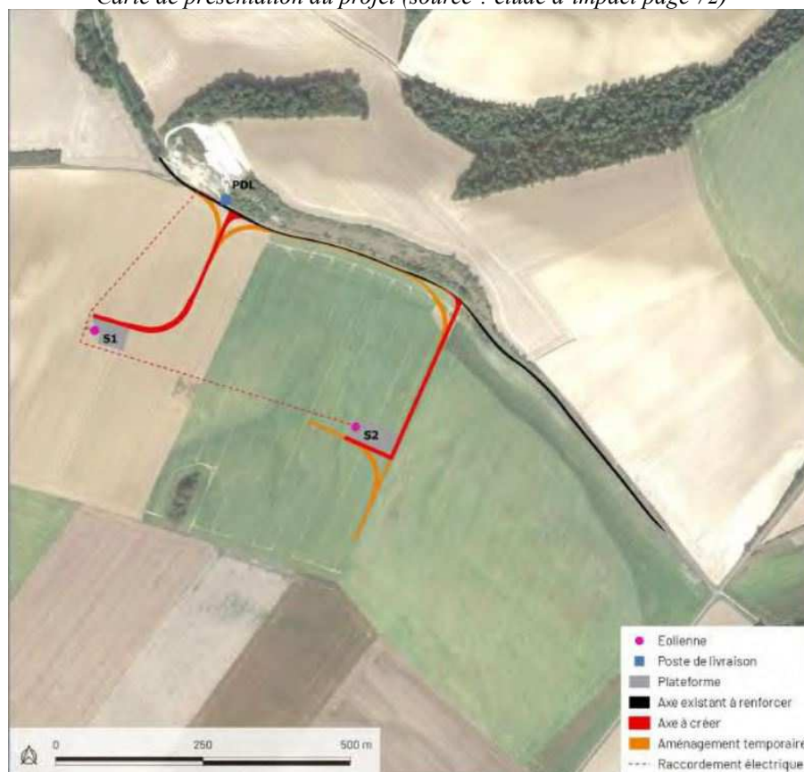
Carte de présentation du projet

2 La garde au sol est la hauteur minimale entre le sol et le bout des pales.